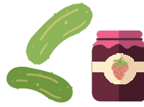
Jams, Khauj noom, Dib Tsaus, thiab Cov Khoom Rau Zaub