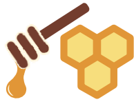
Zib Ntab thiab Cov Khoom Maple