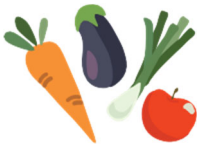
Txiv Hmab Txiv Ntoo thiab Zaub

Koj tuaj yeem siv daim npav P-EBT los yuav tib yam li SNAP cov nyiaj ib txwm muaj. Feem ntau tau txais rau cov zaub mov: