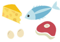
Nqaij, Ntses, Qe, thiab Mis