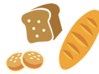
Cov Khauj Ci Noj