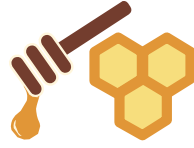
Miel y maple