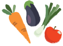
Frutas y vegetales

Puede usar la tarjeta P-EBT para comprar lo mismo que compraría con los beneficios SNAP. La mayoría de los artículos de comida son elegibles: