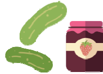
Mermeladas, gelatinas, jaleas, encurtidos y salsas